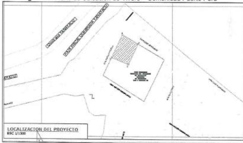
Figura 01: Plano de Ubicación de Vivero – Comunidad Puerto Perú